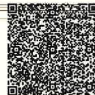
空メール専用QRコード

※詳しい利用登録の申請方法は、岐阜市ホームページに掲載していますので、そちらも見てください、申請をお願いします。