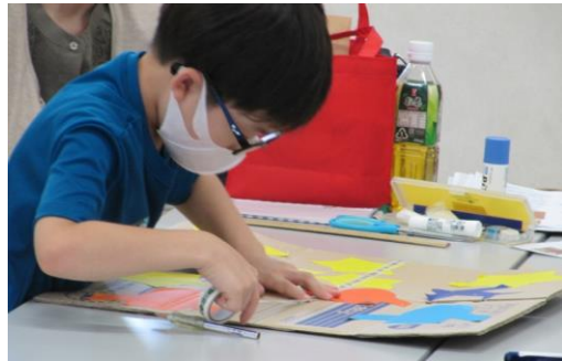
小学生の制作風景

制作の前に「障がいのある方の生活を考える」と題したミニ講話も行いました。参加された方の多くが熱心にメモを取られており、障がい者福祉への関心の高さがうかがえました。