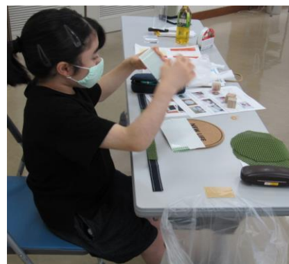
中学生の制作風景

今後も若い皆さんに、障がいのある方の生活を考えるきっかけを提供できれば、と思います。