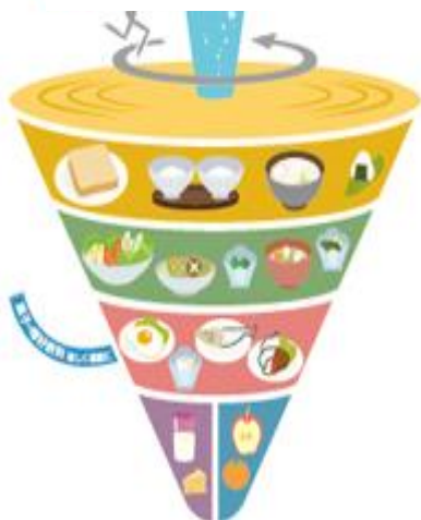
しょくじ 食事バランスガイド

えいよう 栄養バランスの取れた食事内容や適正な量を知り、健康的な食生活を送るための講座です。 りょうり おな おお 料理と同じ大きさのフードモデルを使って、トレーに載せた食事の栄養価を瞬時に判定する体験型栄養教育システム（食育SATシステム）を体験します。管理栄養士からは、自分の食事を見直し、ライフスタイルに合わせて栄養バランスのとれた食事を楽しめるようアドバイスを受けられます。