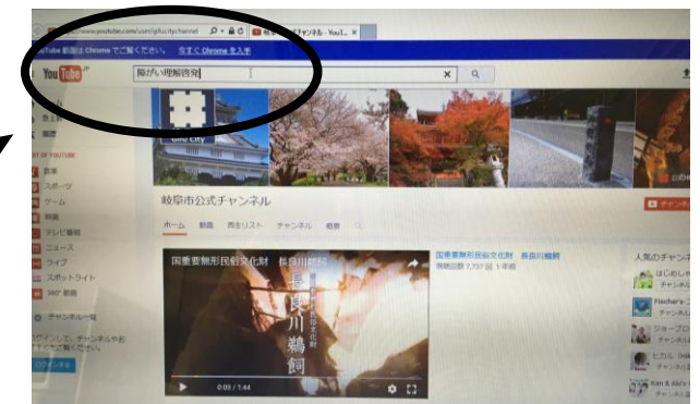
④ YouTube の検索枠に「障がいの理解啓発」と打ち込みます。