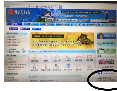
③ 岐阜市公式 YouTube チャンネルをクリック