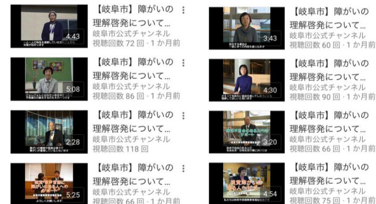
⑤ 見たい項目をクリックで障がい別に見ることができます。尚、冊子は当センターにも置かれていますので、お問い合わせ下さい。